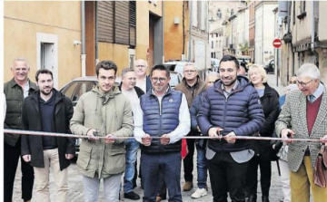
La coupure du ruban tricolore symbolique qui rend la rue ouverte à toute circulation, piétons et véhicules.

Détail du coût des travaux. Coût total du chantier : 526 000 euros HT, avec travaux eau potable (Smec) 120 000 € HT, terrassement + pluvial (commune) 258 000 € HT, pavage (commune) 148 000 € HT. Le projet a été entièrement financé par la municipalité, hors