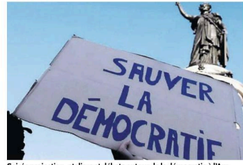
Soirée projection, ateliers et débats autour de la démocratie à l'Amphi.